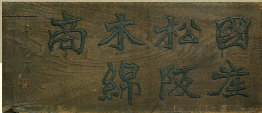
岡又商店看板 (日下部鳴鶴筆)