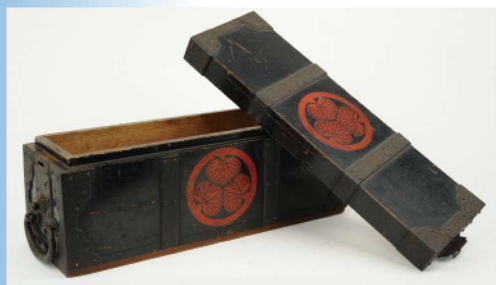
紀州藩御用文書箱(旧長谷川家所蔵)

元和5年(1619)に誕生した紀州藩は、紀伊一国のほかに伊勢国内に勢州三領(松坂・白子・田丸)を領有しました。そのため松坂城下には、勢州三領全体を統治する松坂城代や勢州奉行などの要職が置かれました。紀州藩に関連した資料を通して、紀州藩と松坂の係わりをご紹介します。