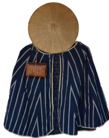
道中合羽と菅笠 (市立歴史民俗資料館所蔵)