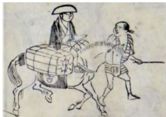
伊勢参宮名所図会 (旧長谷川家所蔵)