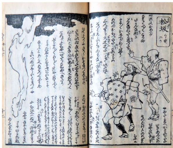
東海道中膝栗毛 (個人所蔵)