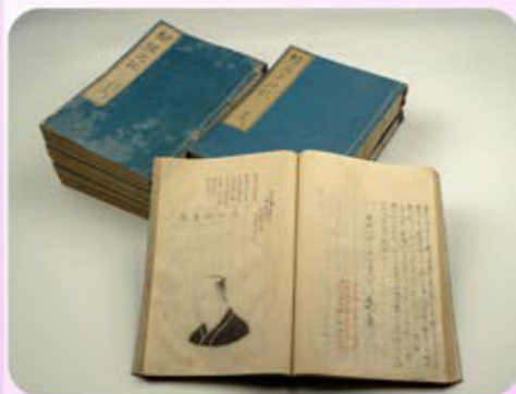
聞まゝの記 長谷川元貞筆

このように、長谷川本家歴代の当主のなかでも文化活動に熱心だった元貞は、頼山陽、中島棕隠、梅辻春樵、貴名海屋らの文化人と交友関係を持ち、そのひとり曲亭馬琴は書簡のなかで「風流家」元貞を評しています。本展では、元貞に係わる生活道具や文書資料を通して、彼がどのような人物であったかをご紹介します。