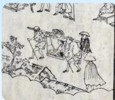
伊勢参宮名所図会

江戸時代になると、全国的に街道や宿場町などの交通環境が整備され、農民や町人の生活が向上したこともあって、庶民による寺社参詣や湯治などの旅が盛んに行われるようになりました。また、旅人が携帯する道中記・巡覧記・名所記などと呼ばれる旅路の宿駅・距離・駄賃・関所・名所旧跡などが記されたガイドブックが盛んに刊行されました。