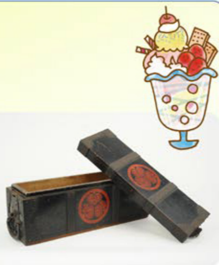
紀州藩御用文書箱

そのため、松坂の中心市街地には、今もその名残を垣間見ることができます。松坂城跡(国史跡)の東側には、松坂城を警護する武士たちが居住していた御城番屋敷(国重要文化財)や、紀州藩士の「同心」クラスの武士たちが住んでいた同心町(現:殿町)があります。本展では、紀州藩に関連した資料を通して紀州藩と松坂の係わりをご紹介します。