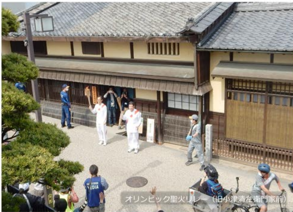
オリンピック聖火リレー (旧小津清左衛門家前)

松坂城跡や御城番屋敷、旧長谷川治郎兵衛家前等、松阪の名所旧跡をつなぐコースを4月8日聖火が駆け抜けました。新型コロナウイルス対策で多くのイベントが中止になるなか、松阪から全国に希望を発信する行事になりました。