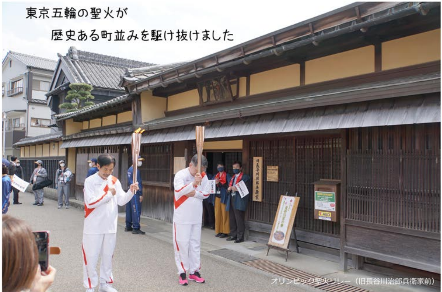
オリンピック聖火リレー (旧長谷川治郎兵衛家前)