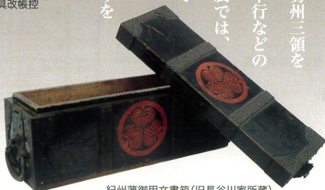
紀州藩御用文書箱（旧長谷川家所蔵）