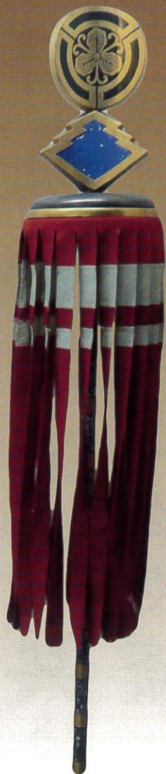
端午の節句飾り「纏」