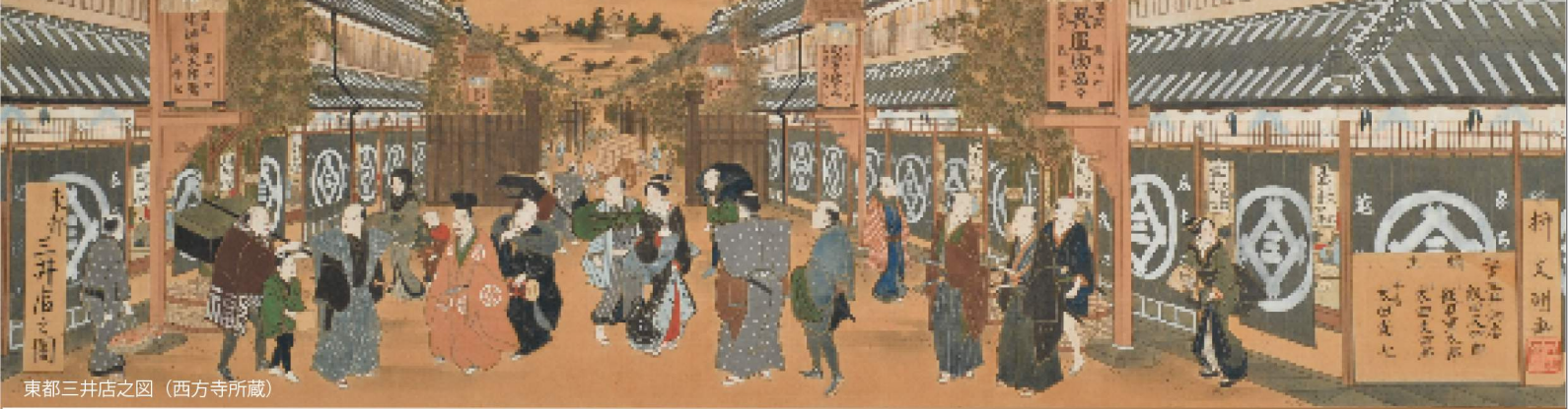
東都三井店之図

江戸時代より日本経済界の大きな存在であった三井家。その家祖 三井高利は、松阪で生まれました。今年の高利生誕400年、来年の三井越後屋創業350年を記念し、三井家に関する資料を通して松阪ゆかりの三井家をご紹介します。