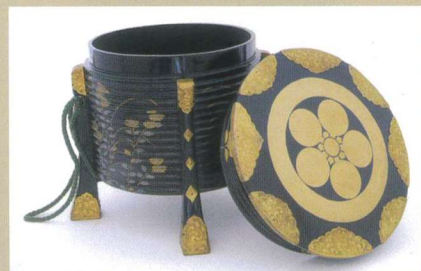
梅鉢紋入秋草蒔絵行器